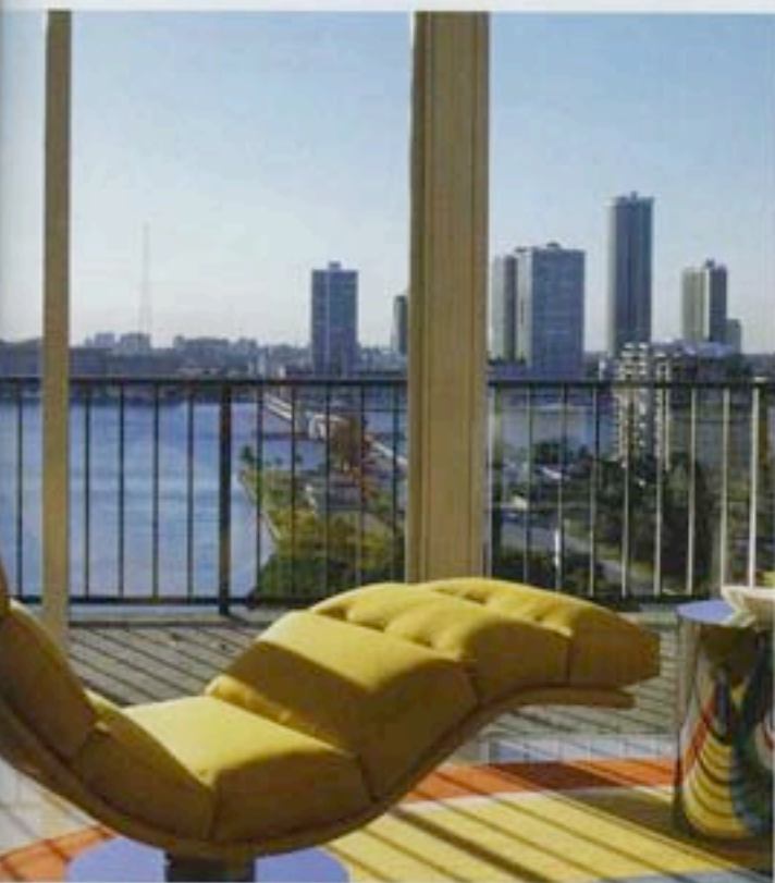
Vue spectaculaire sur Miami depuis la chaise longue vintage de Milo Baughman, célèbre designer américain du XX e siècle, recouverte d'un tissu synthétique jaune citron.